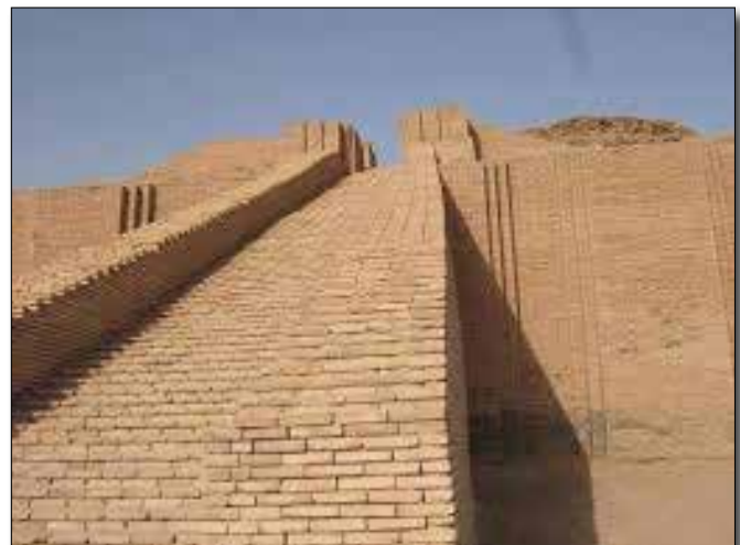
Murallas de la ciudad de Babilonia

Además, Jeremías profetizó: "Egipto como río se ensancha, y las aguas se mueven como ríos, y dijo: Subiré, cubriré la tierra, destruiré a la ciudad y a los que en ella moran". 46:8. "Jeremías aquí compara al ejército egipcio con la corriente de un río". "Así ha dicho Jehová: He aquí que suben aguas del norte, y se harán torrente; inundarán la tierra y su plenitud, la ciudad y los moradores de ella; y los hombres clamarán, y lamentará todo morador de la tierra." Jeremías 47:2.