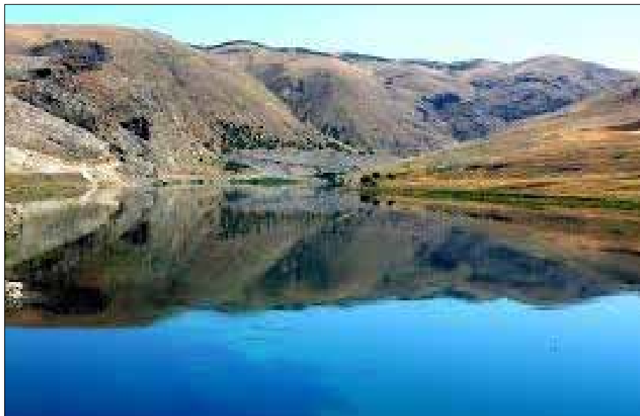
El río Eufartes

Si este pasaje habla de la Babilonia espiritual, ¿qué o quién es ese río espiritual del Éufrates que le da vida? La respuesta es la raza humana. ¿Como y por qué? Descubrimos el significado simbólico. La Babilonia espiritual es Roma. Lo que hace que Roma sea rica y floreciente es en lo que consisten los preparativos para la batalla.