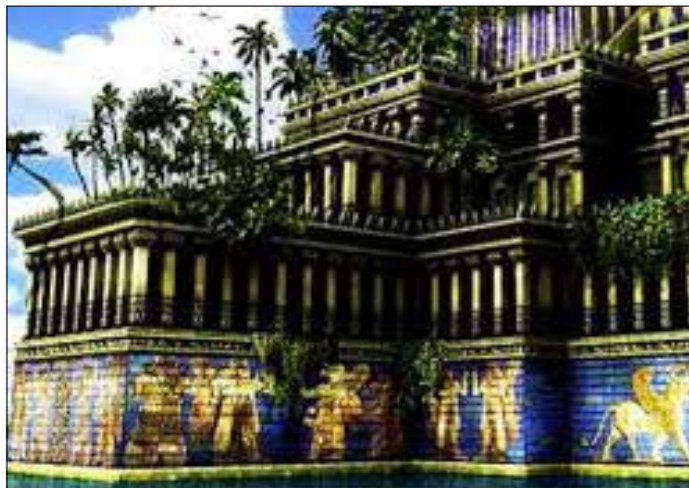
Concepción artística de la ciudad de Babilonia

una solución. Aconsejarán a los líderes mundiales exterminar a quienes observan el séptimo día sábado. Manipularán a los líderes para que creen que aquellos que se santifican el séptimo día deben ser eliminados de la tierra para que Dios restaure sus bendiciones sobre este mundo. Se hará que todos creen que, si los observadores del sábado se eliminan por completo, las plagas de Apocalipsis 16 llegarán a su fin.